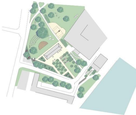
Illustration: Pia Jonsson

Trädgården runt Hovings malmgård kan bli en grön oas i området för alla, vuxna och barn.