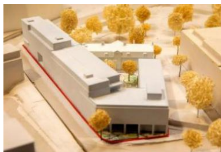
Så här groteskt såg förslaget ut 2023

Om fastighetsägaren och stadsbyggnadskontoret hittar en framkomlig väg är nästa steg att stadsbyggnadsnämnden ska ta ställning till de föreslagna bearbetningarna.”