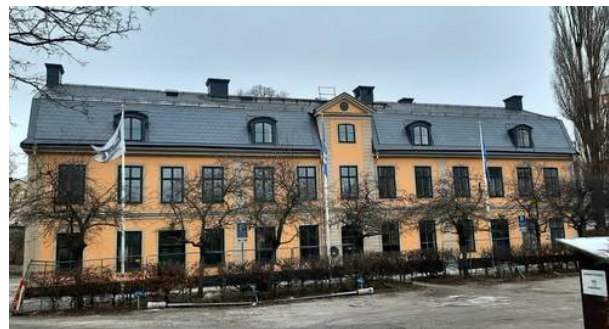
Hovings malmgård från trädgårdssidan i norr och från sjösidan i söder efter EM:s upprustning