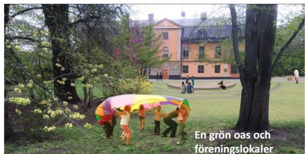
En grön oas och föreningslokaler