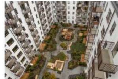
Innergård hos EM vid Tegelviksgatan