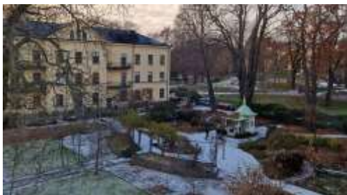
Inspirationsbild, Sinnenas trädgård Sabbatsbergsbyn