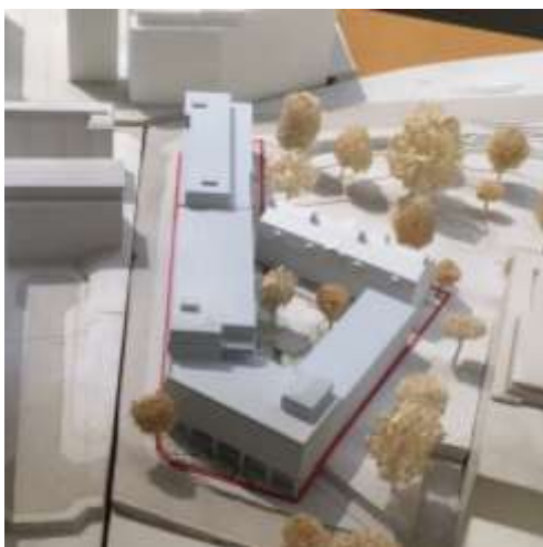
Planförslagets nya bebyggelse kväver Hovings malmgård och raderar ut kulturvärdena

Vi föreslår att politikerna gör ett omtag med ett helhetsgrepp.