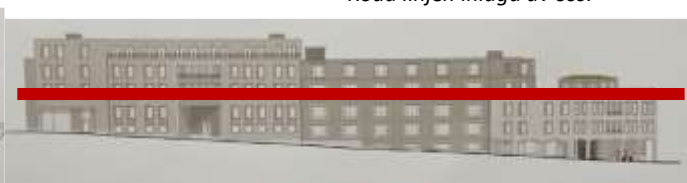
Den föreslagna bebyggelsens fasad utmed Alsnögatans backe mot Hammarby sjö. Malmgårdsbyggnaden helt gömd. Och kommer att förbli gömd från gatan även om bebyggelsen sänks.