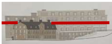
Malmgården sedd från Tegelviksgatan från nordöst

Byggnadsdelarna över den röda linjen skulle behöva tas bort om bebyggelsen ska sänkas till högst som malmgårdens taknockshöjd enligt Länsstyrelsens uppmaning Bildmontage från Fredrik Eckhardts yttrande. Röda linjen inlagd av oss.