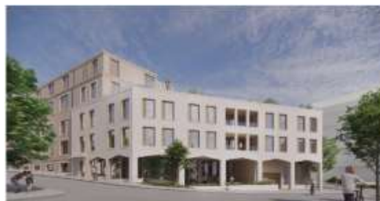
Samma vy med föreslagen ny bebyggelse