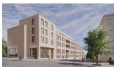
Samma vy med ny bebyggelse