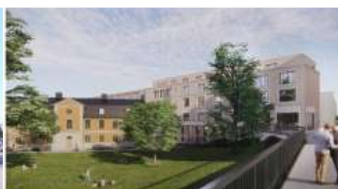
Samma vy med föreslagen ny bebyggelse