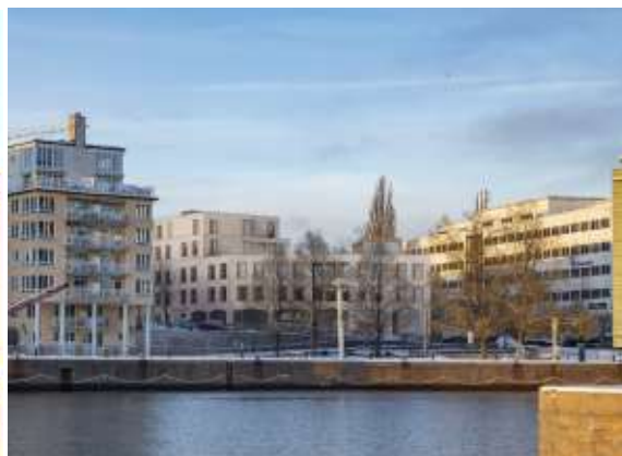
Samma vy med föreslagen ny bebyggelse