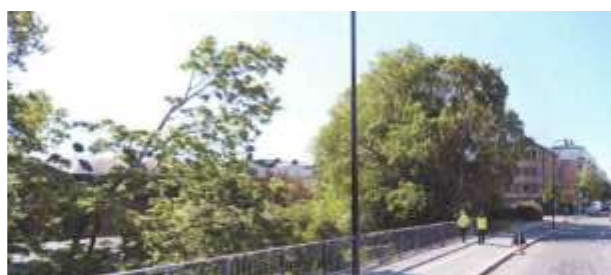
Utmed Tegelviksgatan sett från öster