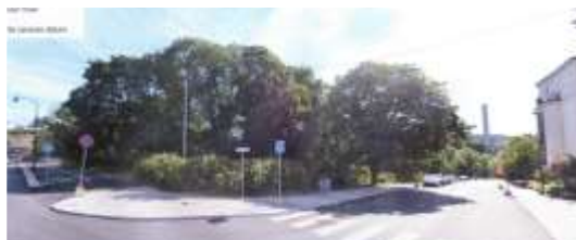
Hörnet Tegelviksgatan/Alsnögatan i dag