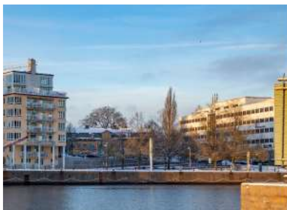
Från andra sidan Hammarby sjö