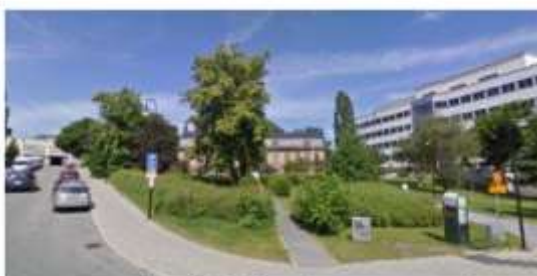
Malmgårdens entrésida från söder vid sjön