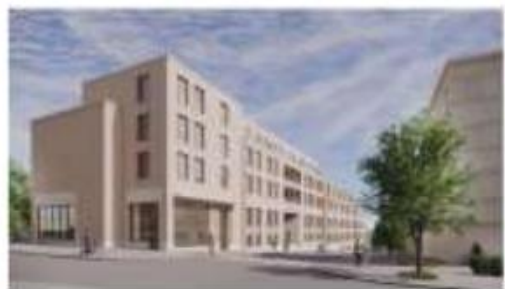
Tegelviksgatan/Alsnögatan utan och med ny bebyggelse.