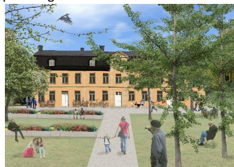
Bilder och parksiss: Pia Jonsson