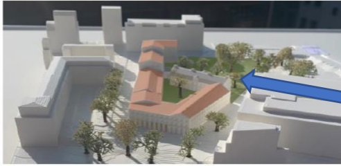
Modellbild av förslaget

Så här ser förslaget till bebyggelse i kulturresevatet Hovings malmgård ut.